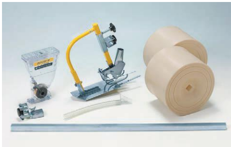
フィルム幅135cm、畝幅100cm、3条用アタッチ 適用機種：AMS-200DW