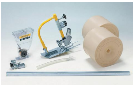
フィルム幅135cm、畝幅100cm、3条用アタッチ 適用機種：AMS-200DW