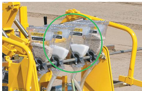
ダイジストン等の粒剤散布 適用機種：AMS-200DW