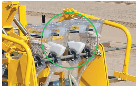
ダイジストン等の粒剤散布 適用機種：AMS-200DW