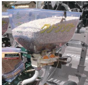
25ℓ 大型肥料ホッパー