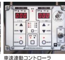
車速連動コントローラ

⚠️ 安全に関するご注意 ・取扱説明書をよくお読みの上、正しく安全にお使いください。