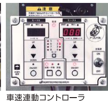
車速連動コントローラ

⚠️ 安全に関するご注意 ・取扱説明書をよくお読みの上、正しく安全にお使いください。